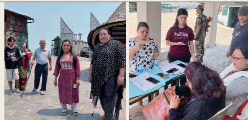
投票をする茶園の人々。

の管理下に置かれ、投票する人以外は立ち入り禁止になりました。インドの選挙権は18歳以上。マカイバリ茶園の有権者は719人です。投票時間は7時から19時。私が12時頃に行った時には、既に449人が投票を済ませていました。マカイバリ茶園では、投票率が毎回ほぼ100%だそうです。投票所に携帯電話の持ち込みは禁止。受付で預けてから投票所に入ります。投票が終わると爪にインクを塗りますが、選挙の後はみんな人差し指にインクが塗られていて、お互いに自慢し合っています。インドは日本と違って、政治や選挙にみんなが興味を持ち、活発に話し合います。今回の選挙はインドの政権交代にも影響が出る総選挙です。デリーの選挙日は5月25日です。開票は6月4日です。